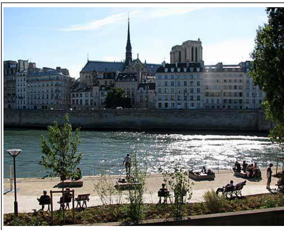
Figura 1. À esquerda as margens do Rio Sena, Paris [FRA]. À direita o futuro Parque Fluvial de Fuengirola, Málaga [ESP].